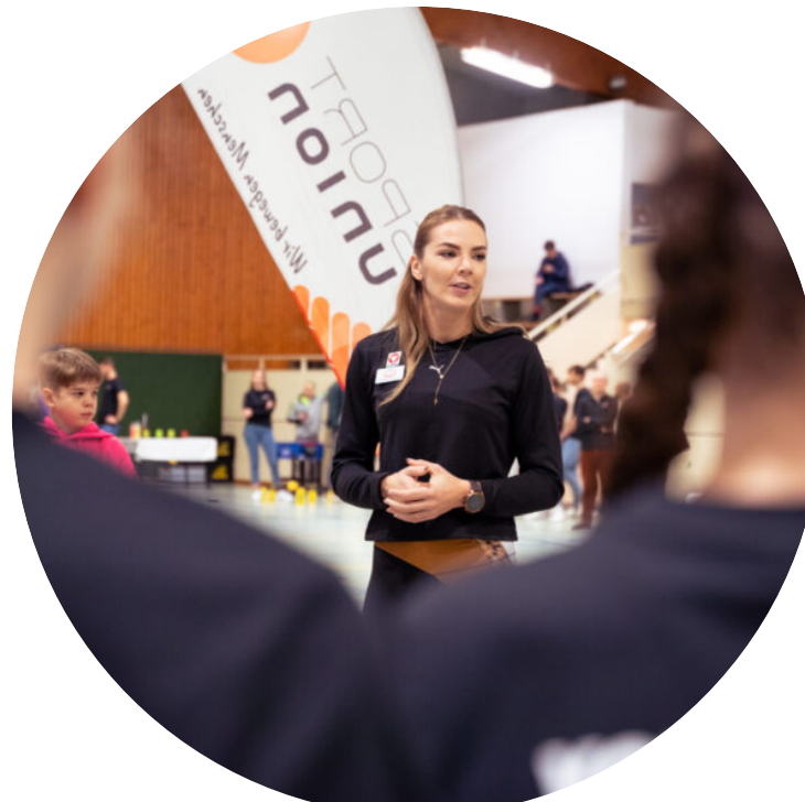
Leichtathletikstar Ivona Dacic